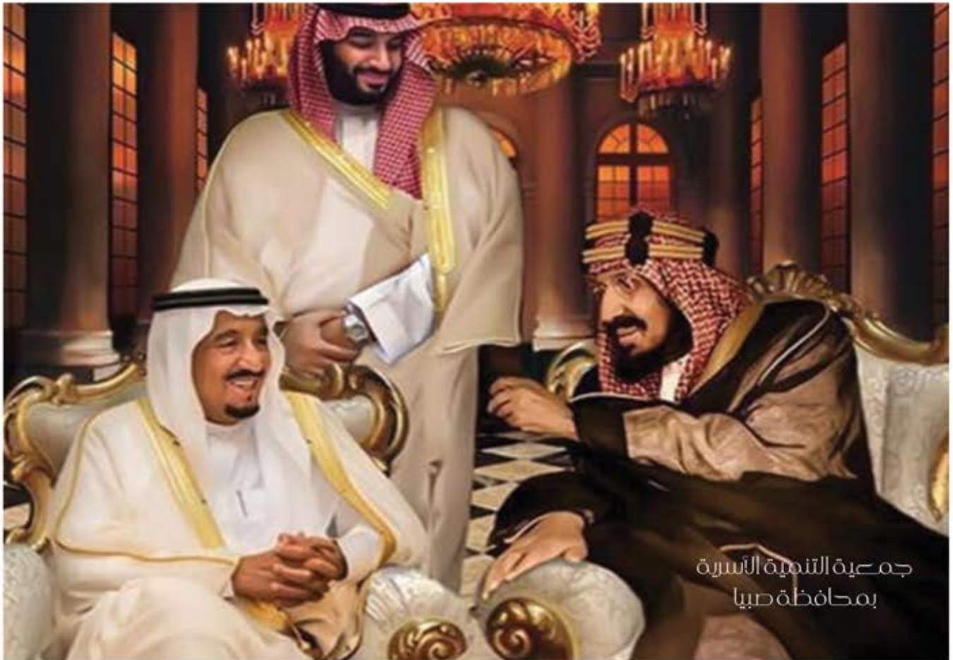
جمعية التنمية الأسرية بمحافظة صبيا